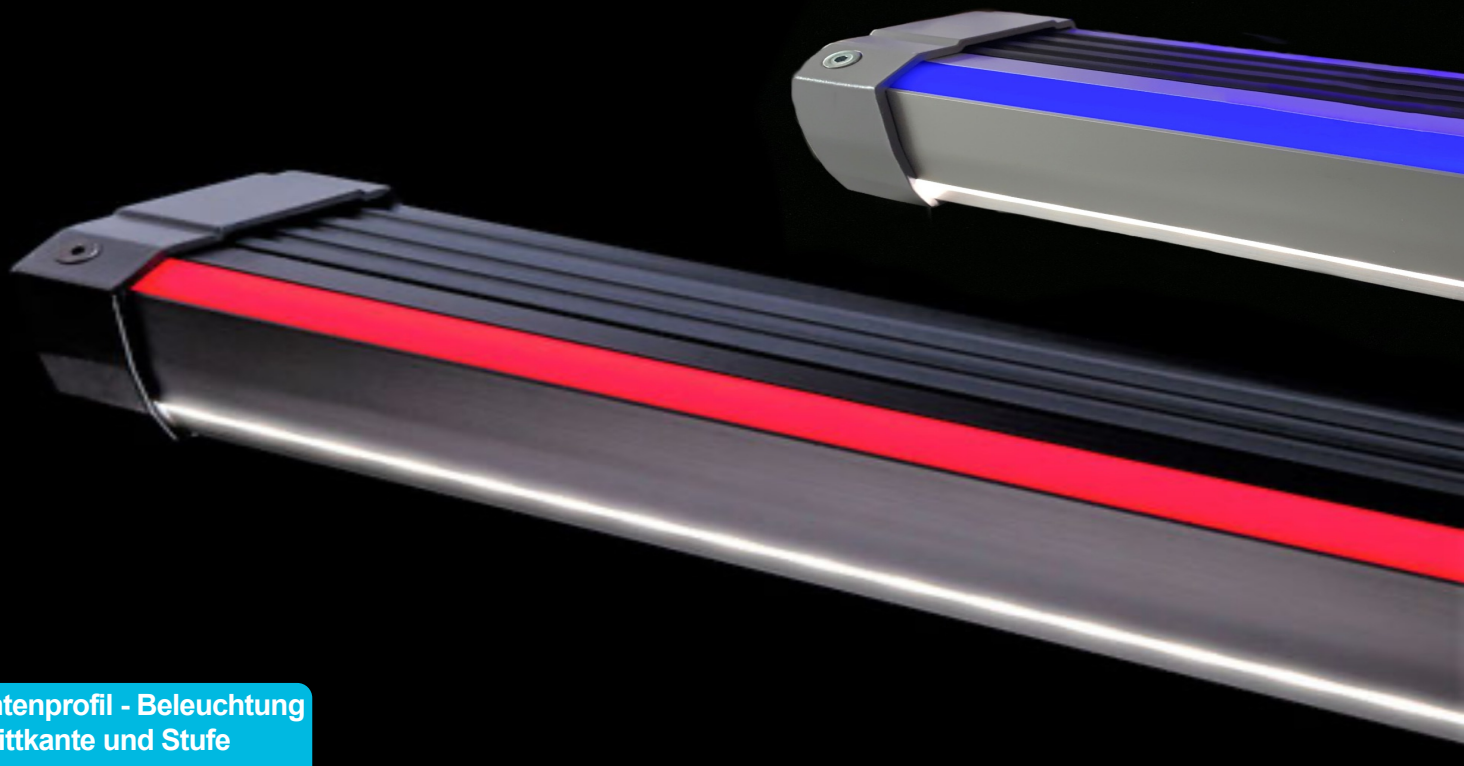
Treppenkantenprofil - Beleuchtung der Trittkante und Stufe